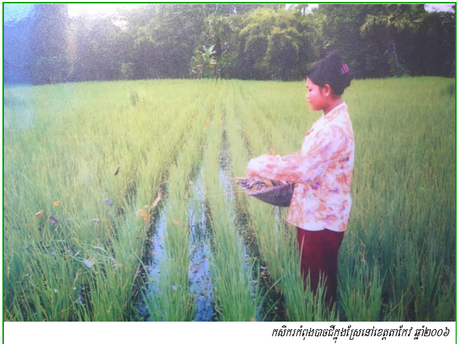
កសិករកំពុងបាចដីក្នុងស្រែនៅខេត្តតាកែវ ឆ្នាំ២០០៦

អត្ថបទនេះ ធ្វើការពិភាក្សាលើការវាយតម្លៃក្នុងគណនីជាតិ កសាងដោយ វិទ្យាស្ថានជាតិស្ថិតិ (NIS) សំរាប់ឆ្នាំ២០០៦ ដែលផ្សាយចេញនៅខែឧសភា ឆ្នាំ២០០៧ ។ អត្ថបទ មានបកស្រាយពីតួលេខសំខាន់ៗនៃការវាយតម្លៃនេះ និងផ្តល់មតិលើបញ្ហាមួយចំនួនដែលផុសឡើង ដូចជា ចំណងភ្ជាប់អនុវិស័យសំខាន់ៗ ទៅនឹងផ្នែកដទៃទៀតនៃសេដ្ឋកិច្ច និងការកែសំរួលកំពុងអនុវត្តលើគណនីជាតិ ។