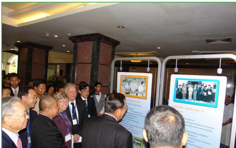
សម្តេចនាយករដ្ឋមន្ត្រី ហ៊ុន សែន កំពុងទស្សនាផ្ទាំងរូបភាពស្តីពីប្រវត្តិរបស់វិទ្យាស្ថាន CDRI ក្នុងរយៈពេល ២០ឆ្នាំ ដែលដាក់តាំងបង្ហាញនៅសន្និសីទចក្ខុវិស័យប្រទេសកម្ពុជាឆ្នាំ២០១០

សន្និសីទចក្ខុវិស័យប្រទេសកម្ពុជា លើកទី៤ លើ ប្រធានបទ "ការសំរេចបានកំណើនសេដ្ឋកិច្ចខ្ពស់ ឡើងវិញ" បានប្រារព្ធឡើងនៅសណ្ឋាគារភ្នំពេញ នៅថ្ងៃទី ១៧ មីនា ២០១០ ក្រោមកិច្ចសហការជា ដៃគូរវាងវិទ្យាស្ថានបណ្តុះបណ្តាល និង ស្រាវជ្រាវ ដើម្បីអភិវឌ្ឍន៍កម្ពុជា (CDRI) និង ធនាគារ ANZ Royal ។ ជាថ្មីម្តងទៀត សម្តេចនាយក រដ្ឋមន្ត្រី ហ៊ុន សែន បានផ្តល់កិត្តិយសដ៏ខ្ពង់ខ្ពស់ តាមការអញ្ជើញចូលរួម ជាអធិបតី និងថ្លែង សុន្ទរកថាគន្លឹះក្នុងពិធីបើកសន្និសីទ ជូនដល់ភ្ញៀវ កិត្តិយសជាង ៣៥០នាក់ ជាថ្នាក់ដឹកនាំមកពី ជួររដ្ឋាភិបាល វិស័យឯកជន ស្ថាប័នស្រាវជ្រាវ អង្គការសង្គមស៊ីវិល និងសហគមន៍អភិវឌ្ឍន៍ អន្តរជាតិ ។