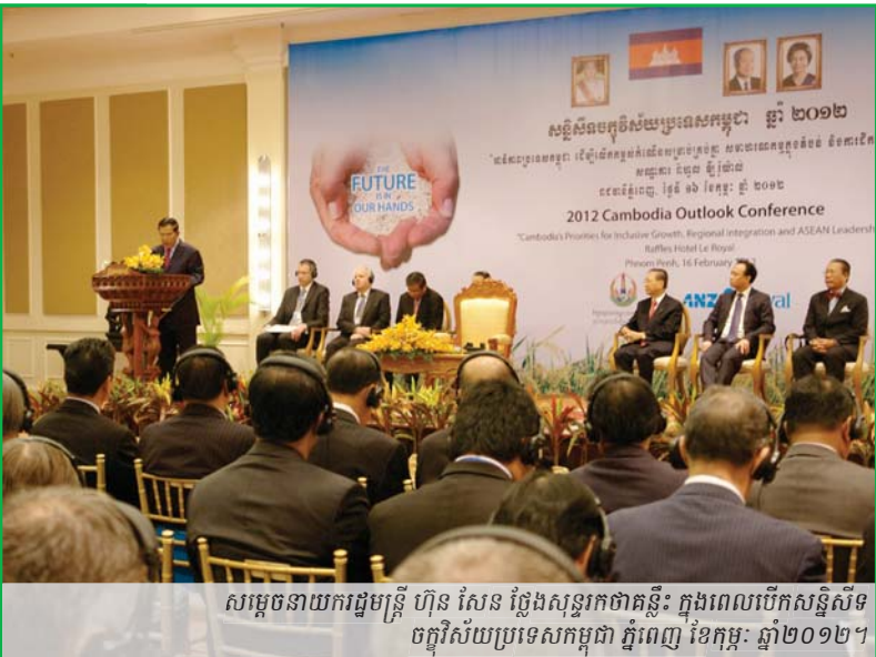
សម្តេចនាយករដ្ឋមន្ត្រី ហ៊ុន សែន ថ្លែងសុន្ទរកថាគន្លឹះ ក្នុងពេលបើកសន្និសីទចក្ខុវិស័យប្រទេសកម្ពុជា ភ្នំពេញ ខែកុម្ភៈ ឆ្នាំ២០១២។

សន្និសីទចក្ខុវិស័យប្រទេសកម្ពុជា លើកទី១៦ បានប្រារព្ធឡើងកាលពីថ្ងៃទី ១៦ កុម្ភៈ ២០១២ នៅរាជធានីភ្នំពេញ ក្រោមមតិចូលរួមពីដៃគូរវាងវិទ្យាស្ថាន CDRI និង ធនាគារ ANZ Royal។ តំណាងជាន់ខ្ពស់មកពីខាងរដ្ឋាភិបាល វិស័យឯកជន ដៃគូអភិវឌ្ឍន៍ សហគមន៍ស្រាវជ្រាវ និងសង្គមស៊ីវិល បានមកជួបជុំគ្នា ពិភាក្សាពី "អាទិភាពប្រទេសកម្ពុជា ដើម្បីលើកកម្ពស់កំណើនសម្រាប់គ្រប់គ្នា សមាហរណកម្មក្នុងតំបន់ និងការដឹកនាំអាស៊ាន"។ ក្នុងពេលថ្ងៃដំបូងនៃសន្និសីទ សម្តេចនាយករដ្ឋមន្ត្រី ហ៊ុន សែន បានកត់សម្គាល់ពីពេលវេលាដ៏ល្អប្រសើរនៃសន្និសីទនេះ គឺមុនពេលកម្ពុជា ទទួលបានវេណាធ្វើជាប្រធានអាស៊ាន ហើយសម្តេច បានគូសបញ្ជាក់ពីតួនាទីសំខាន់នៃសន្និសីទនេះ ក្នុងការផ្តល់គំនិតពីអាទិភាពគោលនយោបាយនានាសម្រាប់ឆ្នាំខាងមុខ។ អត្ថបទនេះ ផ្តល់ទស្សនៈរួមមួយពីបញ្ហាសំខាន់ៗដែលបានលើកឡើងក្នុងវគ្គនីមួយៗ ដោយកំណត់ពីវិស័យដែលរដ្ឋាភិបាល គួរផ្តោតសកម្មភាពលើសម្រាប់ឆ្នាំ២០១២។ បទបង្ហាញនៅក្នុងសន្និសីទ អាចរកបាននៅលើគេហទំព័រ www.cdri.org.kh 1