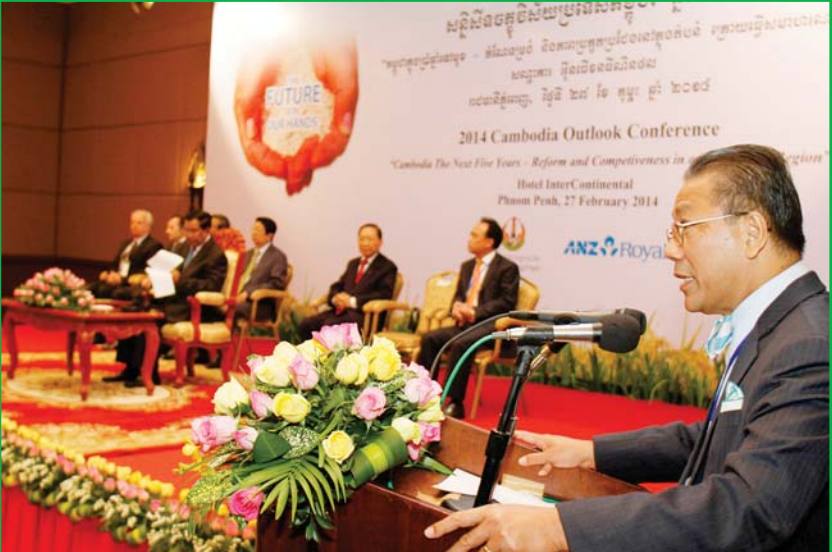
ឯ.ឧ. បណ្ឌិត សុក ស៊ីផាន់ណា ប្រធានក្រុមប្រឹក្សាភិបាលវិទ្យាស្ថាន CDRI ថ្លែងសុន្ទរកថាស្ថាគមន៍ក្នុងពិធីបើកសន្និសីទចក្ខុវិស័យប្រទេសកម្ពុជាឆ្នាំ២០១៤ ក្រោមអធិបតីភាពដ៏ខ្ពង់ខ្ពស់នៃ សម្តេចនាយករដ្ឋមន្ត្រី ហ៊ុន សែន ។

សន្និសីទចក្ខុវិស័យប្រទេសកម្ពុជា លើកទី៨ ដែលជាកិច្ចសហការជាដៃគូរវាងវិទ្យាស្ថាន CDRI និង ធនាគារ ANZ Royal បានប្រារព្ធឡើងនៅថ្ងៃទី ២៧ កុម្ភៈ ២០១៤ នៅរាជធានីភ្នំពេញ។ ថ្នាក់ដឹកនាំមកពីខាង រដ្ឋាភិបាល វិស័យឯកជន ដៃគូអភិវឌ្ឍន៍ សហគមន៍ស្រាវជ្រាវ និង NGOs បានមកជួបជុំគ្នា ដើម្បីពិភាក្សាលើប្រធានបទ "កម្ពុជាក្នុងប្រាំឆ្នាំទៅមុខ - កំណែទម្រង់ និងភាពប្រកួតប្រជែង នៅក្នុងតំបន់ក្រោយធ្វើសមាហរណកម្ម"។ នៅក្នុងសុន្ទរកថាគន្លឹះបើកសន្និសីទ សម្តេចនាយករដ្ឋមន្ត្រី ហ៊ុន សែន បានសរសើរការសាទរ ចំពោះភាពជាដៃគូរយៈពេលវែងប្រកបដោយផ្លែផ្កា រវាង CDRI និង ANZ Royal និងបានគូសបញ្ជាក់ពីតួនាទីដ៏សំខាន់នៃសន្និសីទនេះក្នុងការផ្តល់ព័ត៌មានដល់រដ្ឋាភិបាលអំពីវិស័យដែលត្រូវធ្វើសកម្មភាពខាងគោលនយោបាយ។ អត្ថបទនេះ គូសបញ្ជាក់ពីបញ្ហាខាងគោលនយោបាយសំខាន់ៗ ដែលអ្នកចូលរួមបានលើកឡើងក្នុងវគ្គនានានៃសន្និសីទ។