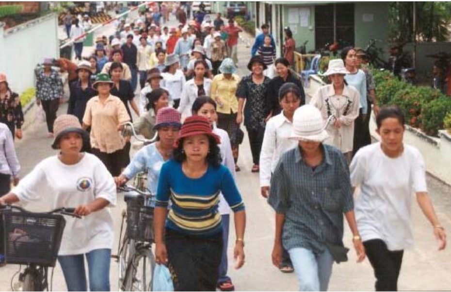
នៅក្នុងឆ្នាំ២០០០ ការនាំចេញសំលៀកបំពាក់របស់ប្រទេសកម្ពុជា មានតម្លៃសរុប ៩៨៥លានដុល្លារ ឬ ៧០% នៃការនាំចេញទាំងអស់ ហើយវិស័យនេះបានផ្តល់ការងារអោយពលករយើងជាង ១៦០.០០០នាក់ ។

ក្នុងមួយរយៈពេលខ្លីប៉ុណ្ណោះ ឧស្សាហកម្ម កាត់ដេរកម្ពុជា បានរីកចម្រើនយ៉ាងខ្លាំងក្លា គ្មានអ្វីសោះ មកក្លាយជាវិស័យនាំចេញដែលនាំ មុខគេនៅក្នុងប្រទេសកម្ពុជា ។ នៅក្នុងឆ្នាំ ២ ០ ០ ០ ០ ការនាំចេញសំលៀកបំពាក់របស់ប្រទេសកម្ពុជា មានតម្លៃសរុប ៩៨៥លាន ដុល្លារ ឬ ៧០% នៃការនាំចេញទាំងអស់ ហើយ វិស័យនេះច ានផ្តល់ ការងារអោយពលករយើង ជាង ១៦០.០០០នាក់ ។