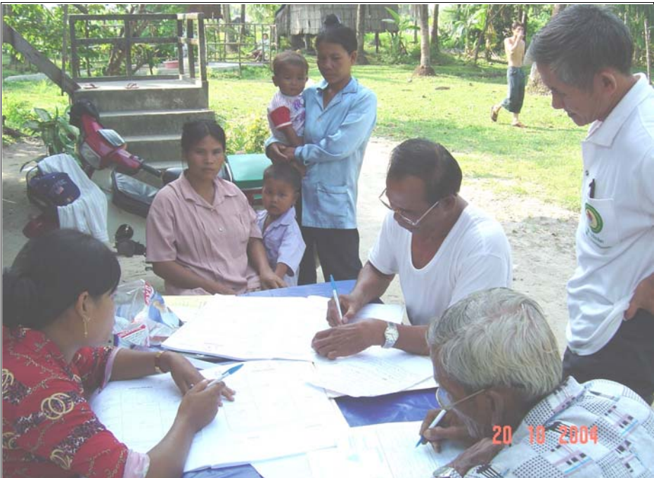
សមាជិកក្រុមប្រឹក្សាឃុំ កំពុងចុះបញ្ជីអត្រាសក្តានុពលដ្ឋាន នៅឃុំព្រែកត្នោត ខេត្តកំពត ។

ផ្នែកលើទិន្នន័យប្រមូលបានពី ៧ឃុំ ក្នុង ៤ខេត្ត (ត្រាំកក់ និងជំរះពេន នៅតាកែវ, សំរោង និងគោកចក នៅសៀមរាប, ព្រៃនប់ នៅក្រុងព្រះ សីហនុ, បឹងព្រលិត និងអូឡាំពិច នៅភ្នំពេញ) ការសិក្សា ១) បានរកឃើញ ជំរើសល្អៗដែលអាចធ្វើកើតសំរាប់ចែករំលែក និងបែងចែកឡើងវិញនូវ ចំណូលពីខេត្ត-ក្រុង (ហៅកាត់ថា ខេត្ត) ទៅឃុំ និង ២) បានពិនិត្យ