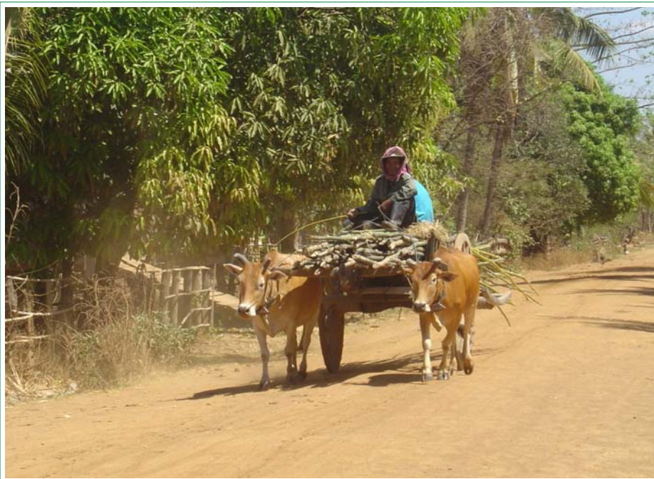
តាមការស្រាវជ្រាវរបស់ វបសអ អ្នកក្រនៅតាមជនបទ ពឹងលើធនធានធម្មជាតិកាន់តែច្រើនឡើងដើម្បីទ្រទ្រង់ជីវភាពរស់នៅពួកគេ

ក្នុងអត្ថបទនេះ វបសអ ពិភាក្សាពីចំណុចសំខាន់ៗនៃការវិភាគ និង