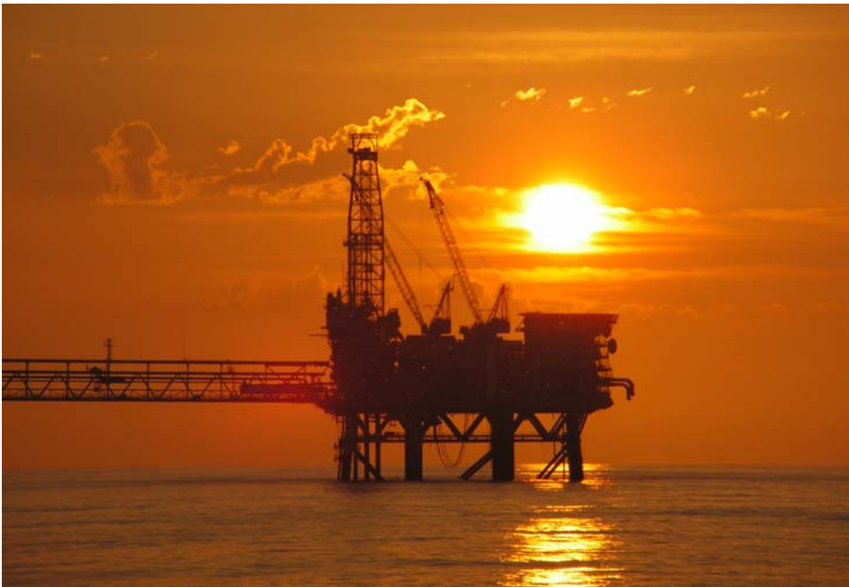
ប្រទេសកម្ពុជាមានតំបន់ប្រេងកាតនៅបាតសមុទ្រ ៦កន្លែង និងតំបន់សម្បទានត្រួតគ្នាមួយ (OCA)

“ខ្ញុំសូមគូសបញ្ជាក់ថា ការពិភាក្សាយ៉ាងយកចិត្តទុកដាក់នៅក្នុងសន្និសីទនេះ ជាពិសេសការផ្តល់នូវគំនិតល្អៗ និងយោបល់ជាក់ស្តែងប្រកបដោយ សិទ្ធិបនកម្ម នឹងរួមចំណែកជួយសំរួលដល់ការអនុវត្តន៍យុទ្ធសាស្ត្រចតុកោណ ផែនការយុទ្ធសាស្ត្រអភិវឌ្ឍន៍ជាតិ ព្រមទាំងរួមចំណែកសំរួលដល់ការសំរេច នៃគោលដៅអភិវឌ្ឍន៍សហវត្សរ៍កម្ពុជាផងដែរ ។”