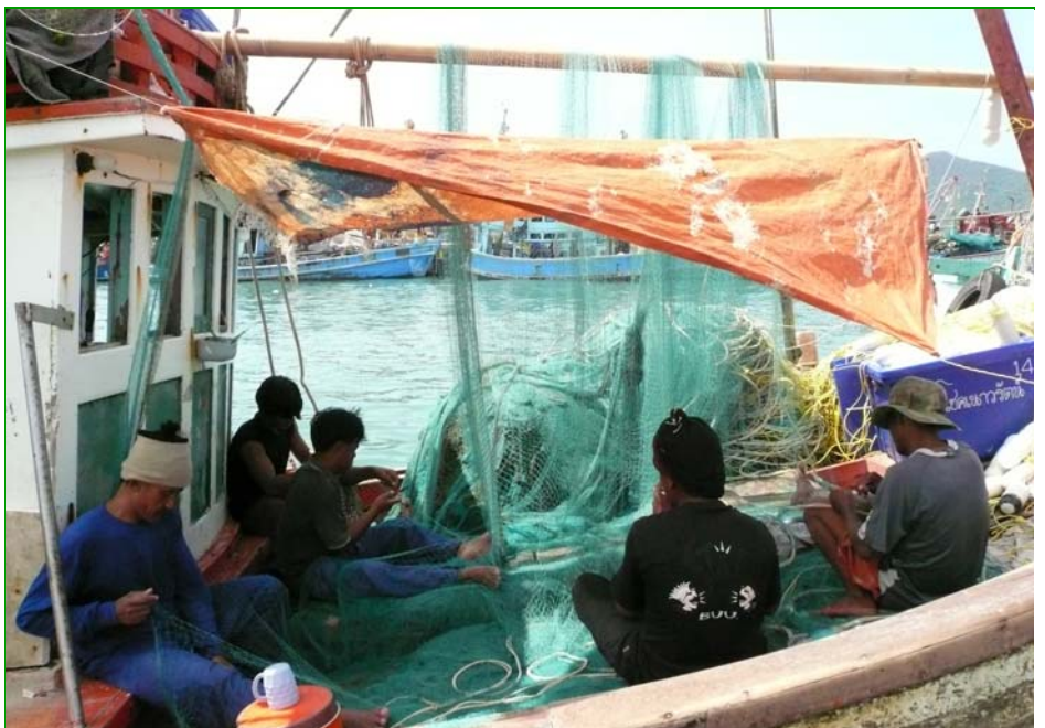
កម្មករចំណាកស្រុកកម្ពុជា ជួសជុលសំណាញ់មុនពេលចុះទេសសាទ ។ ក្នុងមួយឆ្នាំៗ កម្មករប្រមាណ 180.000 នាក់ ចូលទៅក្នុងទឹកដីថៃខុសច្បាប់ ។

ពាក់ព័ន្ធនឹងស្ថាប័ន គោលនយោបាយ និង ក្របខ័ណ្ឌច្បាប់ ស្តីពីការគ្រប់គ្រងធនធាន ប្រទេសពលករកម្ពុជា ប្រទេសកម្ពុជា នៅមាន បទពិសោធន៍តិចជាងប្រទេសដទៃទៀត ។ ពលករភាគច្រើន ធ្វើដំណើរតាមមធ្យោបាយ មិនផ្លូវការ រឺខុសច្បាប់ រឺមធ្យោបាយស្រប ច្បាប់រឺញ ទើបនឹងមានអនុវត្តក្នុងពេលថ្មីៗ ហើយត្រូវចំណាយអស់ច្រើន និងស្មុគស្មាញ ។ ស្ថាប័នរដ្ឋធានា នឹងត្រូវប្រឈមបញ្ហាកាន់តែ ច្រើន ចំពោះការគ្រប់គ្រងចំណាកស្រុកចេញ របស់ពលករដែលរំពឹងថានឹងកើនឡើង ដោយ សារកត្តាទាំងខាងក្នុង និងខាងក្រៅ ។ ការធ្វើ ចំណាកស្រុក ទំនងជានឹងកើនឡើង ដោយសារការបង្កើតការងារក្នុងស្រុក មាន ល្បឿនយឺតយ៉ាវ កំណើនពលករប្រចាំឆ្នាំ ដែលមានប្រហែល ៣០០.០០០នាក់ ។ ប្រាក់ បៀវត្សរ៍ខ្ពស់ជាង និងតម្លៃការពលករនៅ ប្រទេសថៃ ម៉ាឡេស៊ី កូរ៉េខាងត្បូង សិង្ហបុរី និងជប៉ុន គឺជាកត្តាទាក់ទាញ ពីខាងក្រៅ ។