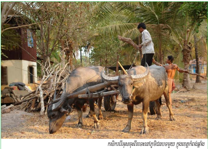
កសិករពីអូសចុះពីរទេះនៅភូមិជនបទមួយ ក្នុងខេត្តកំពង់ឆ្នាំង

ក្នុងប៉ុន្មានឆ្នាំកន្លងមកនេះ វិស័យអ-CDRI បានផ្សព្វផ្សាយរបាយការណ៍ស្រាវជ្រាវ និងឯកសារពិភាក្សាមួយចំនួនស្តីពីភាពក្រីក្រ និងវិសមភាពនៅកម្ពុជា ហើយឯកសារចុងក្រោយបំផុត គឺការសិក្សាពីការចាកផុតភាពក្រីក្រ (Moving Out of Poverty Study: MOPS) ។ ១ MOPS បានប្រើវិធីសាស្ត្រខុសពីវិធីសាស្ត្រតាមទំលាប់ ប៉ុន្តែជាទូទៅបានផ្តល់លទ្ធផលប្រហាក់ប្រហែលគ្នា ។ MOPS និងការសិក្សាផ្សេងទៀតដែលធ្វើឡើងដោយ CDRI និងស្ថាប័នដទៃទៀត ២ បានបង្ហាញភស្តុតាងដ៏ច្រើនថា អ្នកក្រនៅកម្ពុជាទទួលបានផលចំណេញមិនបានច្រើនដូចក្រុមចំនួនដទៃទៀតទេ ព្រោះកំនើនសេដ្ឋកិច្ចវិសេសរបស់កម្ពុជា នៅទសវត្សរ៍ចុងក្រោយនេះ ។ ដូចលទ្ធផលរកឃើញផ្សេងៗទៀតរបស់ CDRI ជាពិសេសការសិក្សាចំនួនពីរ ស្តីពីការចុះបញ្ជីដីដែលទើបចប់សព្វគ្រប់ ៣ ការសិក្សានេះក៏បានរកឃើញពីកំណើនវិសមភាពដែរ ។