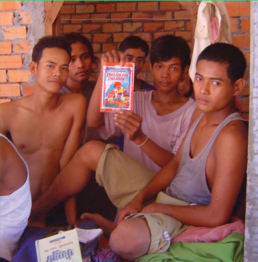
កម្មករ ផ្តិតយុវជនភាសាអង់គ្លេស នៅពេលសំរាកពីការងារសំណង់ នៅឃុំប៉ោយប៉ែត ខេត្តបន្ទាយមានជ័យ

ការសិក្សាមុនៗបានបង្ហាញឡើងថា ចំណាកស្រុកនៅក្នុងប្រទេស មានផលប៉ះពាល់ជាវិជ្ជមាន និងអវិជ្ជមានដល់ការអភិវឌ្ឍ និងការកាត់បន្ថយភាពក្រីក្រ ។ ទោះបីជាផលប៉ះពាល់សុទ្ធនៃការធ្វើចំណាកស្រុក នៅតែស្ថិតក្នុងការពិភាក្សារំកិលព្រឹក្សា ក៏ការធ្វើចំណាកស្រុកនេះអាចជាយុទ្ធសាស្ត្រចិញ្ចឹមជីវិតដ៏សំខាន់មួយ