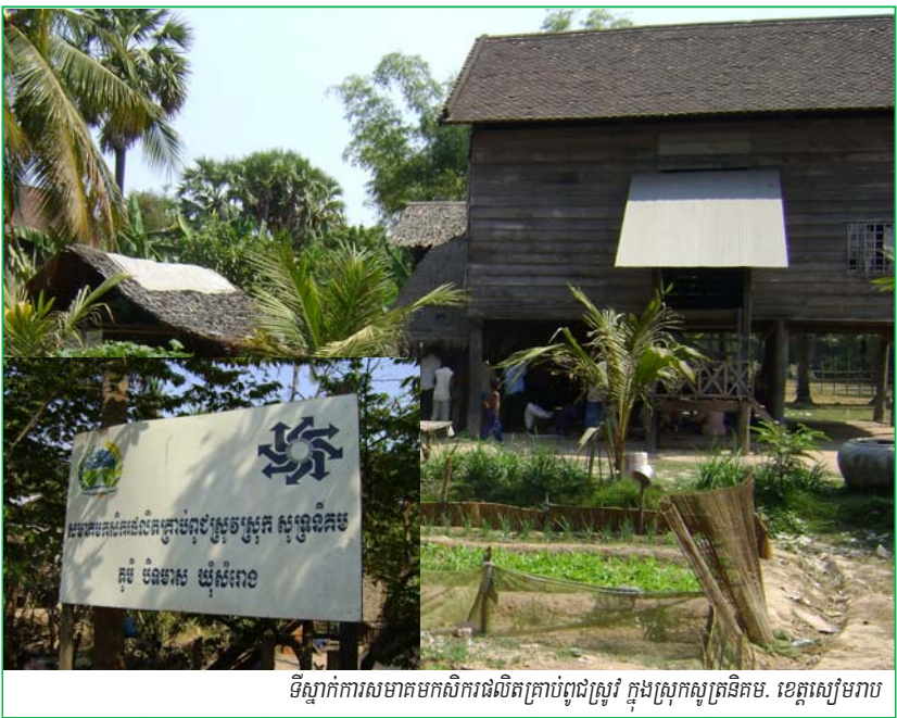
ទីស្នាក់ការសមាគមកសិករផលិតគ្រាប់ពូជស្រូវ ក្នុងស្រុកស្ងួតត្រីកម្ពុជា ខេត្តសៀមរាប

ប្រព័ន្ធផ្តល់សេវាដល់តកម្មនៅជនបទ (Rural Productive Service Delivery Systems: RPSDS) នេះ ពួកអ្នកផ្គត់ផ្គង់បានរៀបចំឡើង ក្នុងគោល គំនិតធានាឱ្យផលិតផល និងសេវាធានាត្រូវបាន ផលិត កែច្នៃ និងបញ្ជូនទីផ្សារ ដើម្បីឱ្យបានទៅដល់ ដៃអតិថិជនទៅទីបញ្ចប់ ។ គំនិតនេះពួកអ្នកផ្គត់ផ្គង់ សេវា ទាំងខាងរដ្ឋាភិបាល វិស័យឯកជន និងសង្គម ស៊ីវិលបានផ្តួចផ្តើមឡើងជាយូរឆ្នាំមកហើយ ។ តាំងពី កម្ពុជាបានអនុវត្តរបបសេដ្ឋកិច្ចទីផ្សារនៅឆ្នាំ១៩៩៣ មក មានវិស័យជាច្រើនបានផ្តល់សេវាផ្សេងៗ ប៉ុន្តែ គេនៅមានការយល់ដឹងតិចតួចនៅឡើយពីប្រសិទ្ធភាព នៃ RPSDS នៅកម្ពុជា ។ ដូច្នេះត្រូវពិនិត្យមើល ឡើងវិញពីប្រព័ន្ធទាំងនេះ ជាពិសេសបញ្ហានានាដែល រាំងស្ទះដល់ការផ្តល់សេវាប្រកបដោយប្រសិទ្ធភាព ។