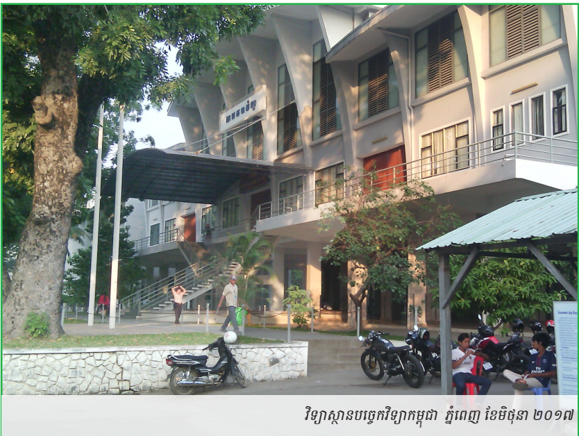
វិទ្យាស្ថានបច្ចេកវិទ្យាកម្ពុជា ភ្នំពេញ ខែមិថុនា ២០១៧

ក្នុងប៉ុន្មានទសវត្សរ៍ កន្លងទៅនេះ ការរីកចម្រើនទាំងផ្នែកការចូលរៀន និងប្រភេទកម្មវិធីនៃ គ្រឹះស្ថានឧត្តមសិក្សា (HEIs) នៅទូទាំងសកលលោក មានលក្ខណៈធំធេងមិនធ្លាប់មានពីមុនមក និងជាបដិវត្តន៍មួយក្នុងការអប់រំថ្នាក់ឧត្តមសិក្សា (Altbach 2017) ។ ការទទួលបានការអប់រំឧត្តមសិក្សាទ្រង់ទ្រាយធំ (massification) បាននាំឲ្យមានការផ្តល់សេវាអប់រំ កាន់តែស្មុគស្មាញ និងចម្រុះបែបឡើង ក្នុងចំណោម គ្រឹះស្ថានឧត្តមសិក្សា។ បញ្ហាចោទកាន់តែបន្ទាន់នៅក្នុងប្រទេសកំពុងអភិវឌ្ឍន៍នានា គឺអ្នកពាក់ព័ន្ធផ្សេងៗ មានការរំពឹងទុកខុសប្លែកគ្នា អំពី គុណភាពលទ្ធផល និងតួនាទីរបស់ គ្រឹះស្ថានឧត្តមសិក្សា។ នាពេលបច្ចុប្បន្ន មានគ្រឹះស្ថានឧត្តមសិក្សា កំពុងបើកដំណើរការនៅតាមបណ្តាខេត្តចំនួន ១៩ និងនៅក្រុងភ្នំពេញ។ ស្ថាប័នរដ្ឋចំនួន ១៥ ជាអ្នកត្រួតពិនិត្យលើគ្រឹះស្ថានឧត្តមសិក្សាចំនួន ១២១ ដែលធ្វើឲ្យអភិបាលកិច្ច និងការត្រួតពិនិត្យគុណភាព ក្លាយជាវិធានការលំបាកស្មុគស្មាញ។ ភាពមិនស៊ីគ្នារវាងការអប់រំ នឹងតម្រូវការទីផ្សារការងារ ធ្វើឲ្យជំនាញដែលនិស្សិតបញ្ចប់ការសិក្សាទទួលបានពី កម្មវិធីសិក្សារបស់ខ្លួន មិនសូវឆ្លើយតបទៅនឹង ជំនាញបច្ចេកទេស ចំណេះដឹង និងអាកប្បកិរិយា ដែលនិយោជក សហគ្រាស និងសង្គម ទាមទារចង់បានក្នុងសតវត្សរ៍ទី២១ នេះ (Khieng, Madhur and Chhem 2015) ។ ក្នុងនេះ មានការយល់ស្របគ្នាជាទូទៅថា គ្រឹះស្ថានឧត្តមសិក្សាភាគច្រើននៅកម្ពុជា ផ្ដោតជាសំខាន់លើការបង្រៀន ដោយយកចិត្តទុកដាក់តិចតួចទៅលើ ការស្រាវជ្រាវ នវានុវត្តន៍ និងទំនាក់ទំនងជាមួយឧស្សាហកម្ម។ ហេតុដូច្នេះ គេអាចនិយាយ