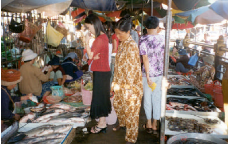
ត្រីទឹកសាប ដាក់តាំងលក់ ដោយគ្មាន ដាក់ទឹកកក នៅផ្សារធំថ្មី

ទៅ ។ ក្នុងករណីជាច្រើន ត្រីដែលនៅសល់រហូតដល់ពេលល្ងាច ឬមួយគេកែច្នៃ វាជាផលិតផលអ្វីមួយថោកជាង ឬមួយលក់ខាត ។ វិធីបញ្ចុះតម្លៃត្រីលក់រាយនេះត្រូវតែប្រើប្រាស់ ពីព្រោះត្រីដែលដាក់តាំងលក់រាយ គេគ្មានដាក់ទឹកកកដើម្បីជួយរក្សាគុណភាព វាទេ ។ ដល់ពេលល្ងាចទៅ ត្រីបានបាត់បង់គុណភាពអស់យ៉ាងច្រើន ។