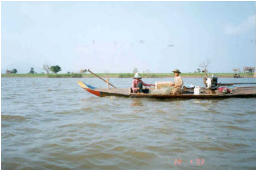
អ្នកនេសាទកំពុងដោះមងនៅទន្លេសាប ខេត្តកំពង់ឆ្នាំង

ក្នុងពេញមួយឆ្នាំៗ មានពាណិជ្ជកររាប់រយនាក់ទិញត្រីពីអ្នកនេសាទរាប់ពាន់នាក់នៅកន្លែងឡើងត្រីកំពង់ឆ្នាំង និងទីរួមខេត្តកំពង់ឆ្នាំង ។ ថ្វីបើសកម្មភាពលក់ត្រីទទួលបានលទ្ធផលអំពីបរិមាណត្រីចាប់បាន (រយៈពេលត្រីសំបូរ និងមិនសំបូរ) តាមពេលខុសគ្នាក្នុងមួយឆ្នាំៗក្តី ប៉ុន្តែអ្នកនេសាទ និងពាណិជ្ជកររាយការណ៍ថា បទបញ្ជាបិទរដូវនេសាទមានឥទ្ធិពលតិចតួចលើពាណិជ្ជកម្មត្រី ដោយសារកង្វះវិធានការពង្រឹងការអនុវត្តច្បាប់ ១ ។ អ្នកនេសាទដែលបានឆ្លើយនឹងសំណួរ បានចេញទៅចាប់ត្រីប្រហែល ២០០-២៥០ថ្ងៃ/ឆ្នាំ ហើយពាណិជ្ជកររាយការណ៍ថាបានជួញដូរត្រីស្ទើរតែរាល់ថ្ងៃ ។ មិនយូរមេត្តាមានតួនាទីខុសប្លែកគ្នាតាមភេទទេ: ទាំងបុរស និងស្ត្រី មានប្រកបរបរជាអ្នកនេសាទ និងពាណិជ្ជករ ហើយជារឿយៗក្នុងលក្ខណៈជាអង្គការគ្រួសារដែលមានប្តី ប្រពន្ធ កូន និងសាច់ញាតិ ។