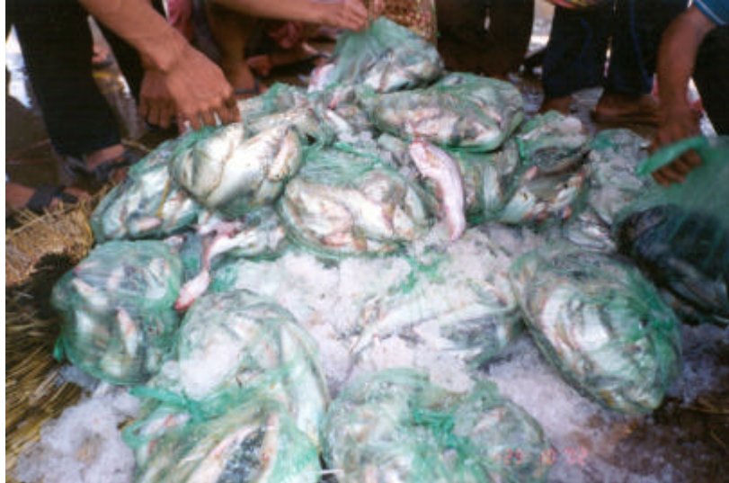
ត្រីមកពីបឹងទន្លេសាបដាក់ក្នុងទឹកកក នៅមណ្ឌលបែងចែកផលនេសាទច្រាំងចំរេះ សំរាប់លក់ឱ្យអ្នកលក់រាយ

ស្រដៀងគ្នានឹងការលក់ត្រីទឹកសាបមកពីបឹងទន្លេសាបដែរ ទឹកកកត្រូវបានប្រើប្រាស់ក្នុងគ្រប់ដំណាក់កាល ម៉ាយីទីងត្រី ទឹកប្រៃតាំងពីឆ្នេរសមុទ្រមកដល់ភ្នំពេញ ។ ប៉ុន្តែខុសពីត្រីទឹកសាប អ្នកលក់រាយនៅទីផ្សារភ្នំពេញដាក់តាំងត្រីទឹកប្រៃលក់ដោយ ដាក់ទឹកកក ។ អ្នកលក់រាយប្រាប់ថា អ្នកប្រើប្រាស់ធ្លាប់ឃើញជាធម្មតាហើយនូវការប្រើប្រាស់ទឹកកកសំរាប់រក្សា និងដាក់តាំងត្រី ទឹកប្រៃ ។ អ្នកប្រើប្រាស់យល់ថា ត្រីទឹកប្រៃចាប់បាននៅឆ្នាយពីភ្នំពេញ ដូច្នេះត្រូវតែរក្សាវាក្នុងទឹកកកដើម្បីរក្សាភាពស្រស់ ។ ការយល់ឃើញនេះធ្វើឱ្យអ្នកលក់រាយអាចប្រើទឹកកកអាចរក្សាគុណភាពត្រី និងរក្សាថ្លៃត្រីទឹកប្រៃឱ្យមានស្ថិរភាពពេញៗមួយថ្ងៃ ។ ជុំយទៅវិញ អ្នកប្រើប្រាស់ត្រីទឹកសាបគិតថា ត្រីទឹកសាបចាប់នៅកន្លែងជិតៗ ដឹកមកផ្សារភ្លាមៗ និងលក់ស្រស់ៗដោយមិនបាច់ ត្រូវការទឹកកក ។ ថ្វីបើ ការយល់ឃើញបែបនេះអាចពិតមែនកាលពីដើម ប៉ុន្តែសព្វថ្ងៃវាលែងត្រឹមត្រូវទៀតហើយ ។