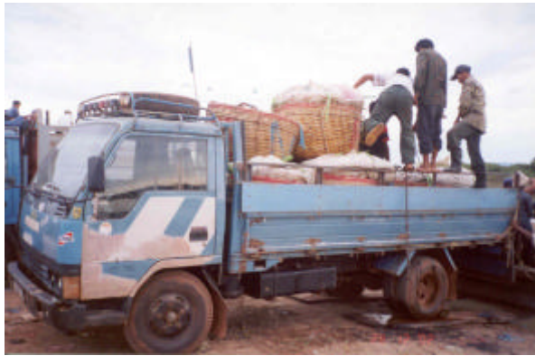
កម្មករកំពុងផ្ទុកត្រីលើរថយន្តនៅកន្លែងឡើងត្រីកំពង់លូង ខេត្តពោធិសាត់

ប៉ុន្តែ បទសំភាសន៍នានាជាមួយអ្នកបែងចែកនៅ មណ្ឌលច្រាំងចំរេះ និងច្បារអំពៅ បានផ្តល់គំនិតថា មណ្ឌលបែងចែកទាំងបី មានបែបបទដំណើរការប្រហាក់ ប្រហែលគ្នា ។