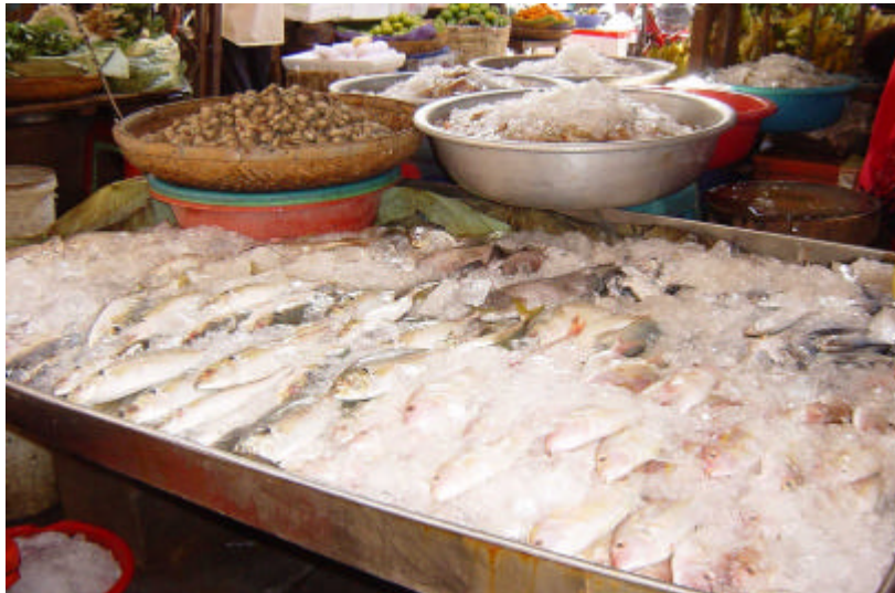
ត្រីទឹកប្រៃដាក់តាំងលក់ដោយរក្សានៅក្នុងទឹកកក នៅផ្សារធំថ្មី

ស្រដៀងគ្នានឹងការលក់ត្រីទឹកសាបមកពីបឹងទន្លេសាបដែរ ទឹកកកត្រូវបានប្រើប្រាស់ក្នុងគ្រប់ដំណាក់កាល ម៉ាយីទីងត្រី ទឹកប្រៃតាំងពីឆ្នេរសមុទ្រមកដល់ភ្នំពេញ ។ ប៉ុន្តែខុសពីត្រីទឹកសាប អ្នកលក់រាយនៅទីផ្សារភ្នំពេញដាក់តាំងត្រីទឹកប្រៃលក់ដោយ ដាក់ទឹកកក ។ អ្នកលក់រាយប្រាប់ថា អ្នកប្រើប្រាស់ធ្លាប់ឃើញជាធម្មតាហើយនូវការប្រើប្រាស់ទឹកកកសំរាប់រក្សា និងដាក់តាំងត្រី ទឹកប្រៃ ។ អ្នកប្រើប្រាស់យល់ថា ត្រីទឹកប្រៃចាប់បាននៅឆ្នាយពីភ្នំពេញ ដូច្នេះត្រូវតែរក្សាវាក្នុងទឹកកកដើម្បីរក្សាភាពស្រស់ ។ ការយល់ឃើញនេះធ្វើឱ្យអ្នកលក់រាយអាចប្រើទឹកកកអាចរក្សាគុណភាពត្រី និងរក្សាថ្លៃត្រីទឹកប្រៃឱ្យមានស្ថិរភាពពេញៗមួយថ្ងៃ ។ ជុំយទៅវិញ អ្នកប្រើប្រាស់ត្រីទឹកសាបគិតថា ត្រីទឹកសាបចាប់នៅកន្លែងជិតៗ ដឹកមកផ្សារភ្លាមៗ និងលក់ស្រស់ៗដោយមិនបាច់ ត្រូវការទឹកកក ។ ថ្វីបើ ការយល់ឃើញបែបនេះអាចពិតមែនកាលពីដើម ប៉ុន្តែសព្វថ្ងៃវាលែងត្រឹមត្រូវទៀតហើយ ។