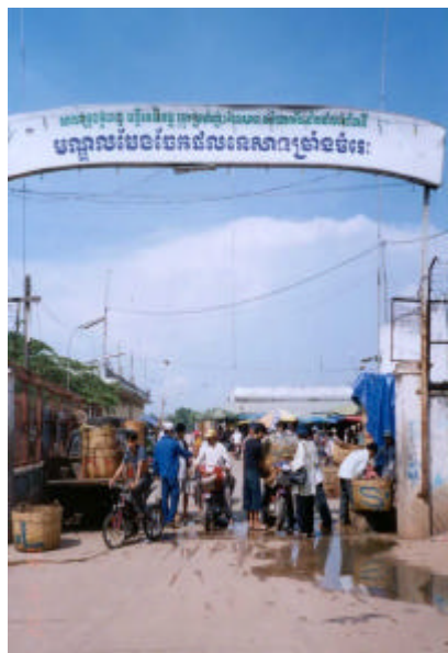
មណ្ឌលបែងចែកផលនេសាទច្រាំងចំរេះ

បន្ថែមទៅលើការបង់ប្រាក់កំរើខាងលើឱ្យអ្នកបែងចែក ពាណិជ្ជករត្រូវ បង់ប្រាក់ឱ្យម្ចាស់មណ្ឌលបែងចែកចំនួន ៣% ទៀតលើចំណូលលក់បានទាំងអស់ ។ បុគ្គលិកមណ្ឌលបែងចែកពិនិត្យតានដានការលក់នីមួយៗ និងកត់ត្រាចំណូល និង ថ្លៃលក់ ប៉ុន្តែមិនប្រមូលប្រាក់កំរើ ៣% នៅពេលនោះភ្លាមទេ ។ អ្នកបែងចែក ត្រូវប្រមូលប្រាក់កំរើ ៣% នេះពីពាណិជ្ជករ និងទូទាត់បង់ឱ្យបុគ្គលិកមណ្ឌលបែង ចែកនៅពេលចាប់ផ្តើមដំណើរការលក់ដូរនាព្រឹកបន្ទាប់ ។