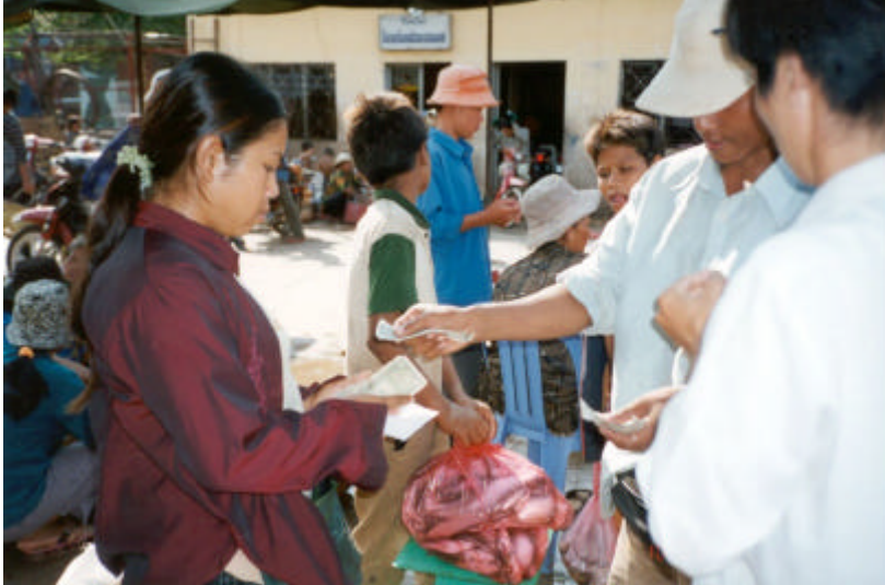
អ្នកលក់រាយកំពុងបង់ប្រាក់ទិញទិញពាណិជ្ជករ នៅមណ្ឌលបែងចែកផលនេសាទច្រាំងចំរេះ